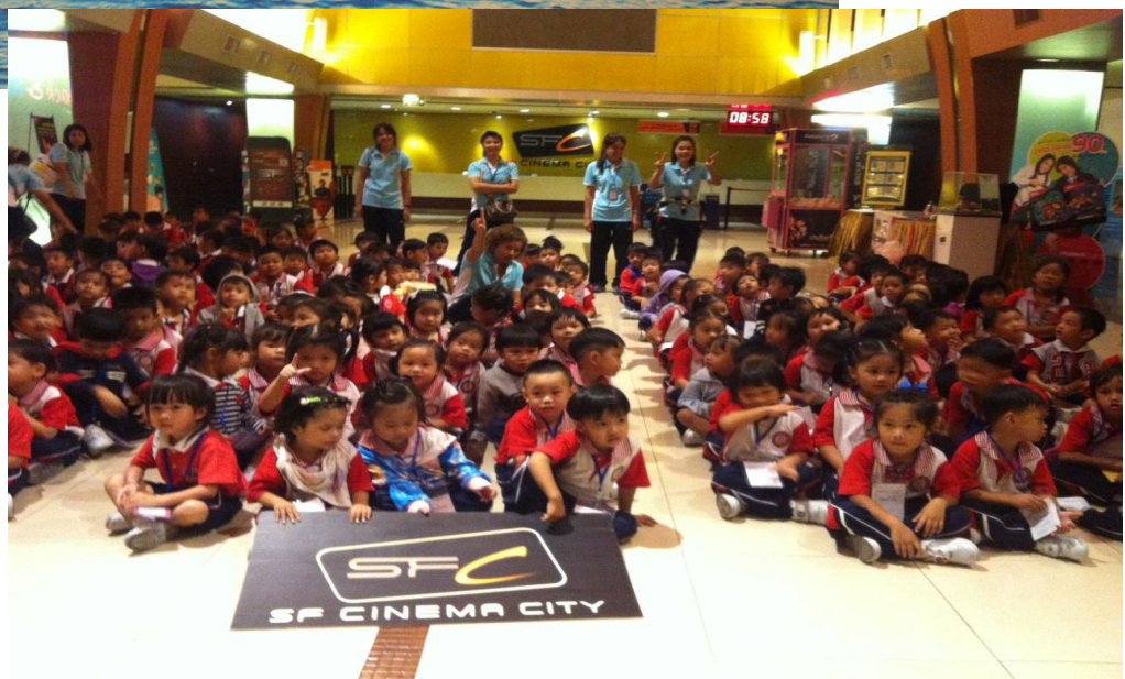
สารสนเทศ โรงเรียนช่างคากู้ศึกษา (แผนกปฐมวัย) 2558