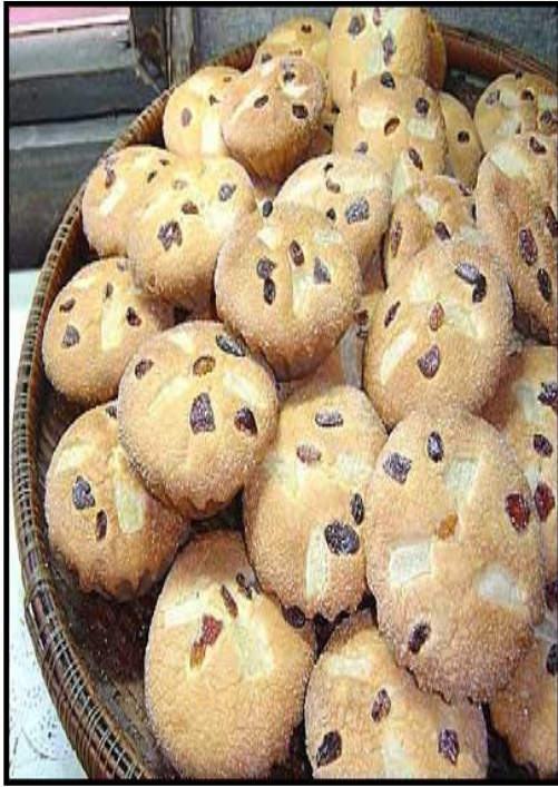
ขนมฝรั่งกุฎีจีน