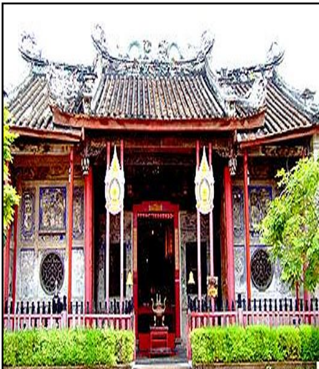
ศาลเจ้าแม่กวนอิม