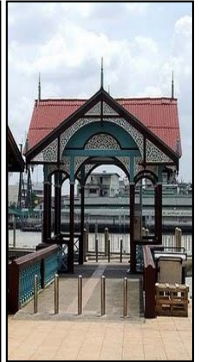
ท่าเทียบเรือกุฎีจีน