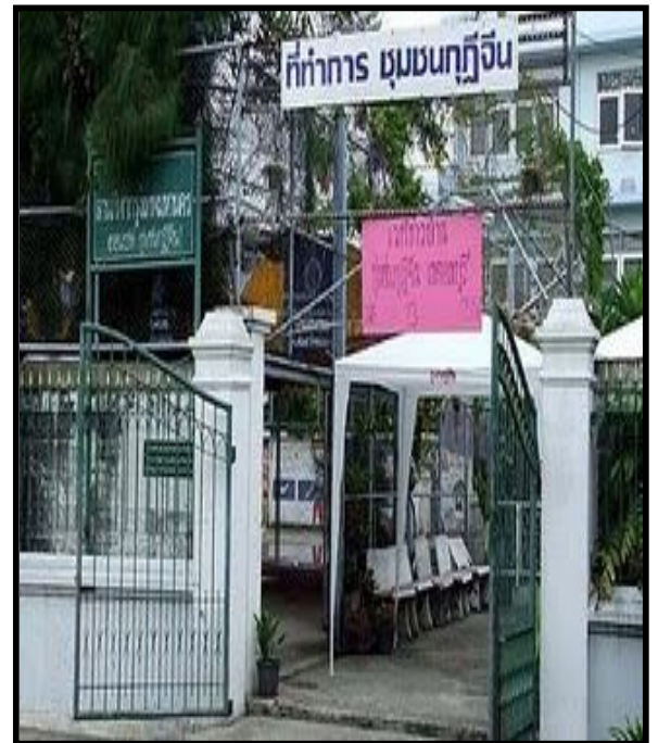
ชุมชนกุฎีจีน